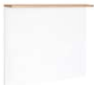
] 9206 [ 140x113,6x22