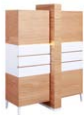
] 9216 [ 134x181,4x58,7