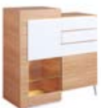
] 9214 [ 120x126x47,5