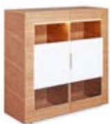
] 9209 [ 120x126x47,5