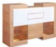
] 9215 [ 180x126x47,5