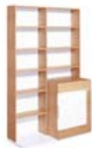
] 9207 [ 110x185x47,5