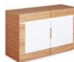
] 9208 [ 120x80,6x47,5