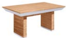
] 9204 [ 160-240x78x95