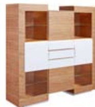
] 9218 [ 180x181,4x47,5