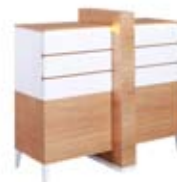
] 9213 [ 134x126x58,7