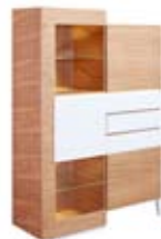
] 9217 [ 120x181,4x47,5